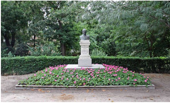
Monumento a Andrés Eloy Blanco en el Parque del Retiro, Madrid.